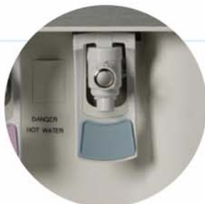
Grifo de agua con selector de temperatura

Oficinas, gimnasios, centros sociales, talleres, comercios, hoteles, consultorios médicos, escuelas, universidades, comedores colectivos, etc.