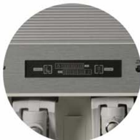
Display indicador de funciones