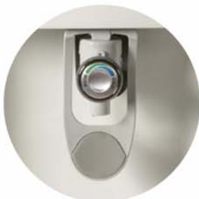
Grifo de agua con regulación de temperatura