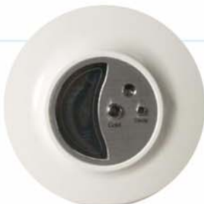
Display indicador de funciones

Oficinas, gimnasios, centros sociales, talleres, comercios, hoteles, consultorios médicos, escuelas, universidades, comedores colectivos, etc.